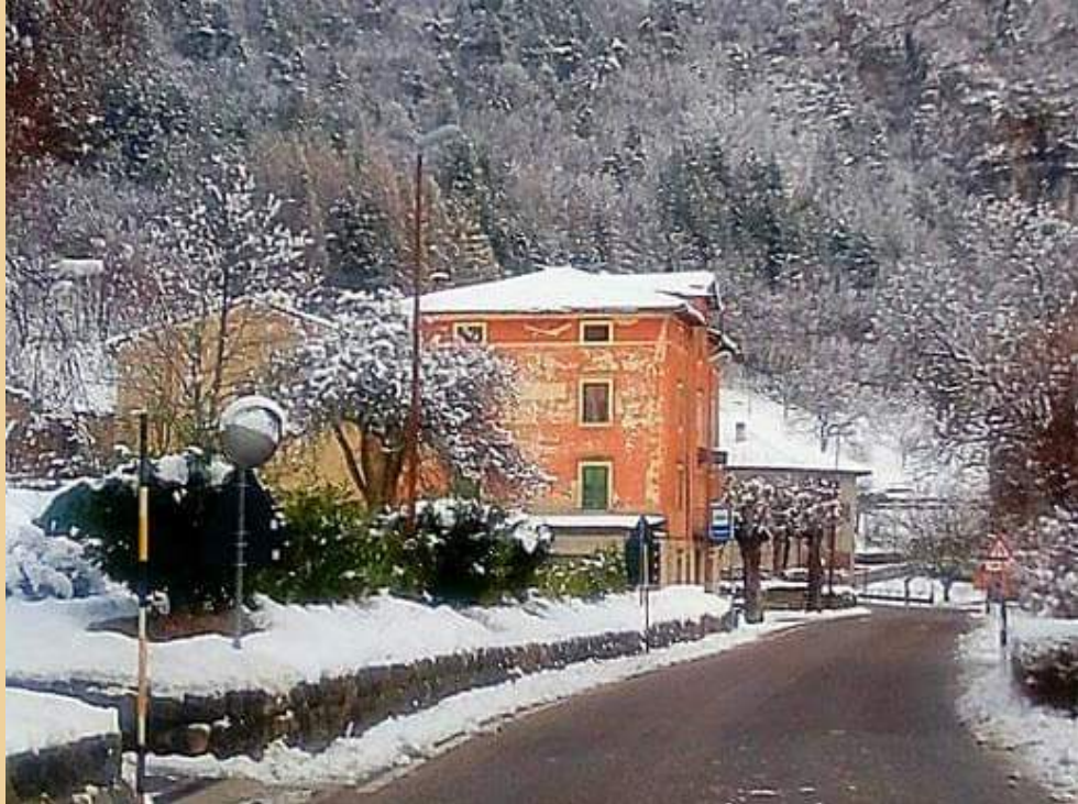
PIANO DI VALLARSA, TRENTO